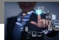
Télécoms, Médias & Technologies