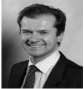
Emmanuel de Mortemart