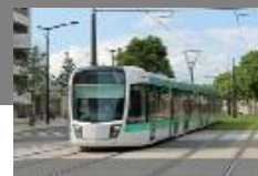
Produits industriels Transport