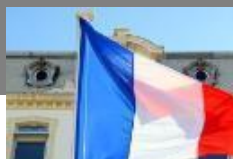
Secteur public, Banques et Assurances