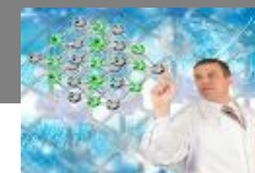
Sciences de la Vie et Santé