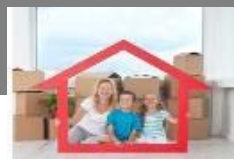
Immobilier Capital investissement