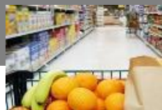
Distribution Grande consommation